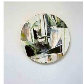
Jildau Nijboer - tableau vijf_04 Links: Jildau Nijboer - fragment opstelling tableau no. III

Beiden zagen buiten wellicht hetzelfde en hebben ook vergelijkbare, onherkenbare delen geschilderd, maar arriveerden er via een volkomen andere route. De aanpak van Brouwer is vrij klassiek, terwijl Nijboer met haar multimediale aanpak modernere middelen benut. Maar het is niet nodig een oordelende vergelijking te maken. Beide kunstenaars bieden ons een onderzoekende blik op de wereld, een verschillende manier van kijken en zijn, zo te zien, nog lang niet klaar met maken.